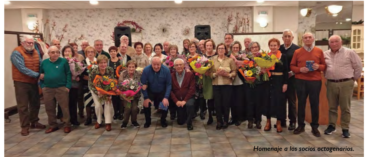
Homenaje a los socios octogenarios.