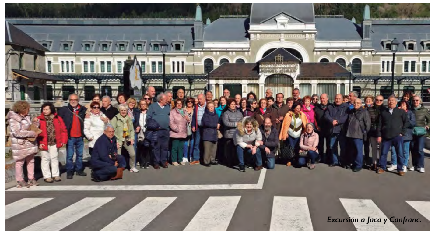
Excursión a Jaca y Canfranc.

Al acabar la visita guiada, y dado que la temperatura era bastante baja (y seguía bajando) emprendimos la vuelta a Pamplona, donde llegamos (después de pasar un buen día) hacia las 21 horas.