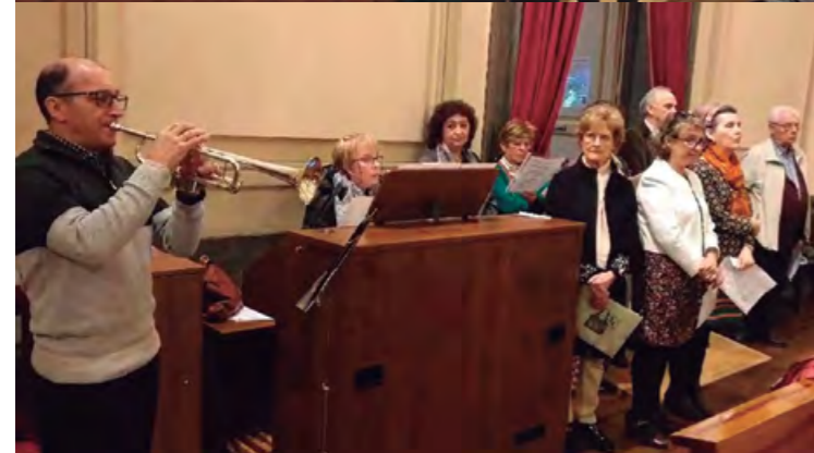
Homenaje a los socios, compañeros y familiares fallecidos.

Comenzamos el año con nuestras actividades regulares. Cursos de inglés, clases de baile, de guitarra, de informática/manejo del móvil, Curso de la Memoria, etc. Hemos tenido que cancelar algunos por escasas personas apuntadas (curso de costura, sesiones de Mindfulness, etc.)