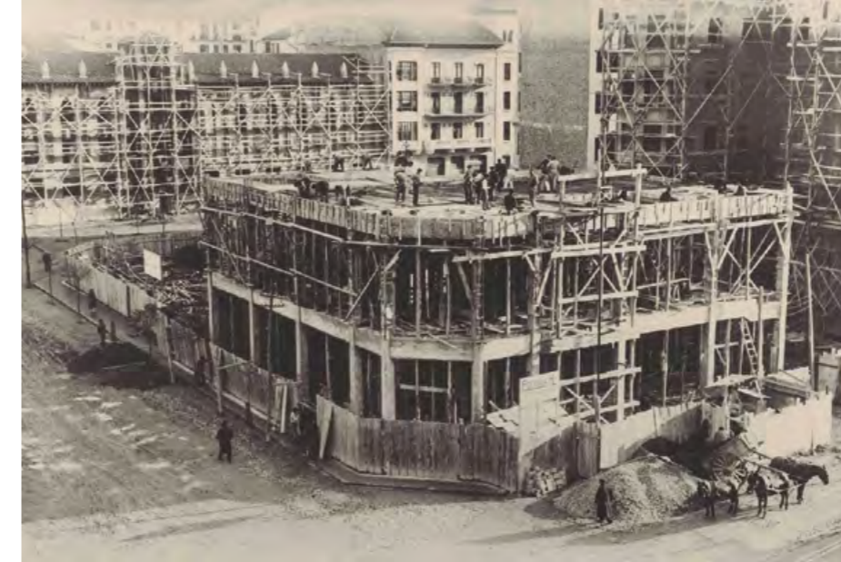
Construcción de la central telefónica de Pamplona/Cortes (1926)

Empezando con aquellas primeras centralitas manuales atendidas por operadoras en todos los pueblos y ciudades del país, pasando luego por las centrales automáticas electromecánicas, que en los años 80 del pasado siglo dieron paso a la digitalización; para finalmente pasar a la banda ancha, la fibra óptica y las redes de telefonía móvil actuales que han facilitado no solo la comunicación sino han cambiado nuestra forma de trabajar, nuestra forma de entretenernos, la forma de investigar, la de estudiar, etc.