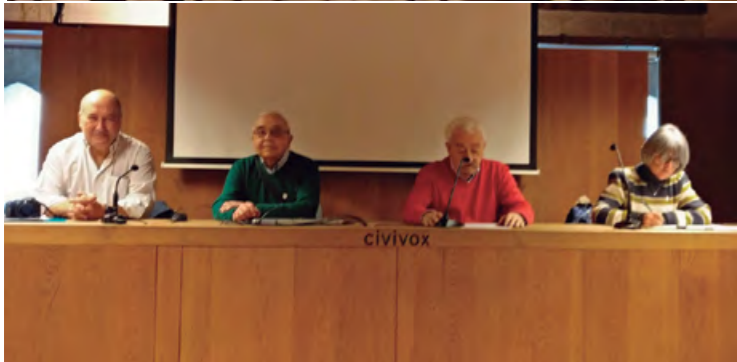
Asamblea General Ordinaria.