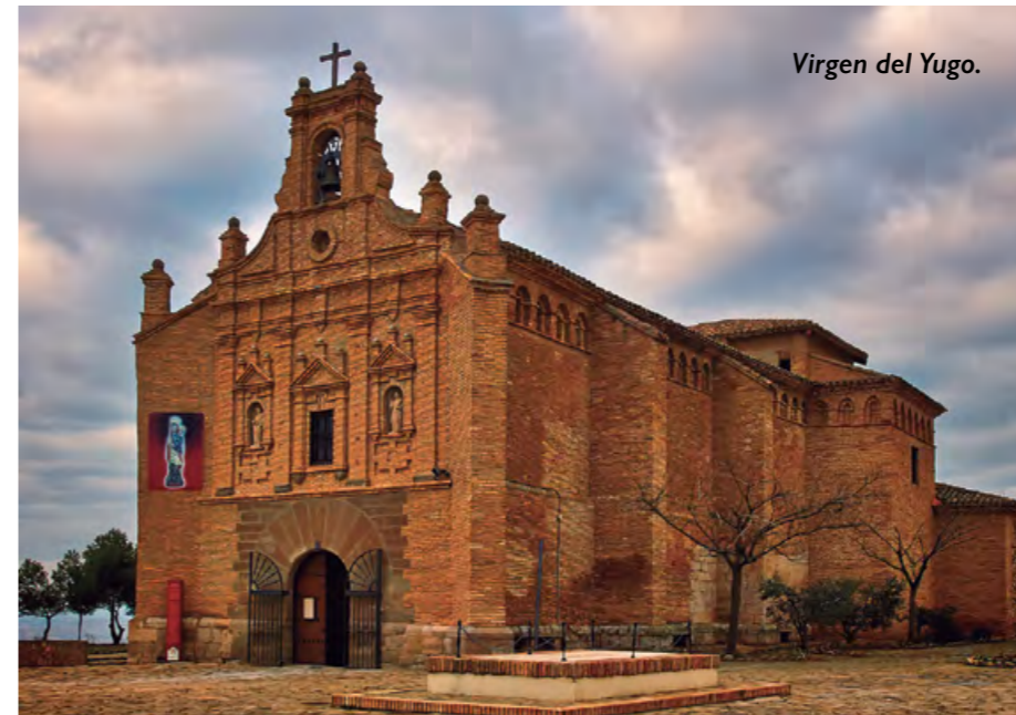
Virgen del Yugo.

Más información e inscribirse en viajes San Fermín: c/Bernardino Tirapu I (Rochapea), teléfono 948 13 20 40 o vía email en info@sanferminviajes.com.